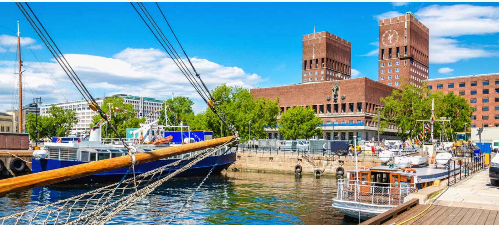
Rathaus in Oslo