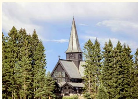
Kapelle auf dem Holmenkollen