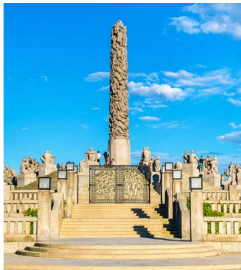
Frogner Park - Oslo

Der heutige Tag gehört nahezu komplett dem großartigen am 11.6.2022 eröffnetem Nationalmuseum Oslos. Eigentlich beherbergt es fünf Museen unter einem Dach. Stellen Sie sich Ihren ganz individuellen Museumsrundgang zusammen, oder aber entdecken Sie die vielen Höhepunkte der umfangreichen Sammlungen zusammen mit Ihrem Globalis-Reiseleiter. Er kennt das Haus bereits bestens und steht Ihnen mit vielen Tipps und Anregungen zur Seite. Auch im Nationalmuseum finden Sie viele Werke des norwegischen Malers von Weltruf Edvard Munch, u.a. das bereits erwähnte erste Gemälde mit dem Titel „Der Schrei“. Um 15:30 Uhr unternehmen wir dann eine Bootstour durch die Fjordwelt Oslos und genießen das sich uns bietende Panorama und die malerische Fjordwelt. Die Tour endet gegen 18:00 Uhr wieder in