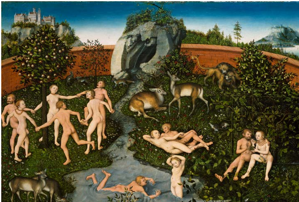
Lucas Cranach der Ältere: Das Goldene Zeitalter