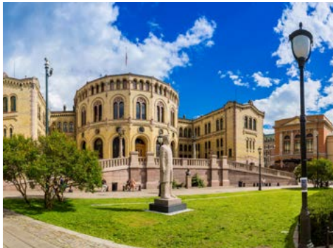
Parlament in Oslo