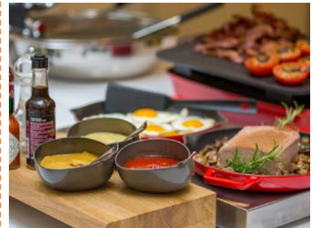
Umfangreiches Frühstück im Hotel