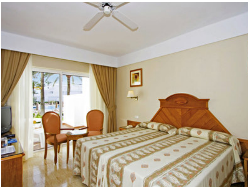
Wohnbeispiel Doppelzimmer Standard

Balkon oder Terrasse: mit Sitzgelegenheit