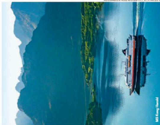
MS Kong Harald