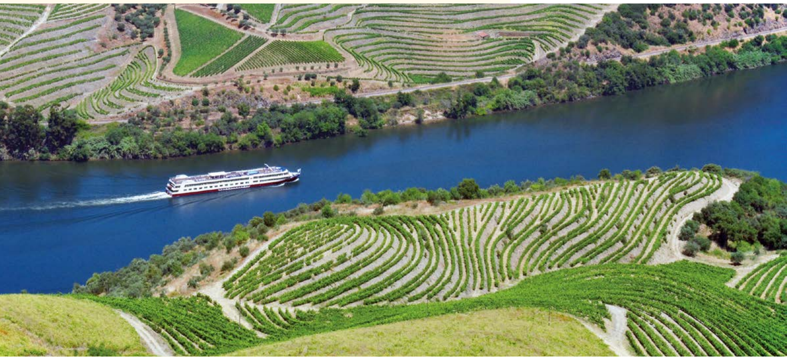
MS Douro Cruiser