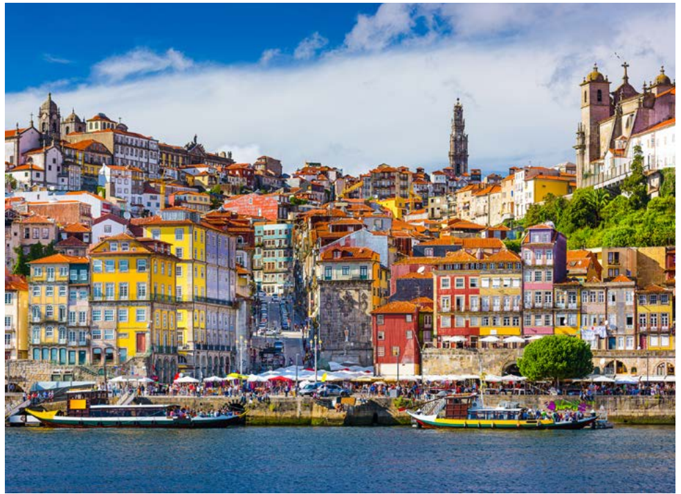
Die Altstadt von Porto

Am Vormittag haben Sie im Rahmen des Ausflugsprogramms (AP) die Möglichkeit zur Teilnahme an einem Ausflug nach Lamego. Das portugiesische Barockstädtchen ist eine bekannte Pilgerstätte rund um die letzte Ruhestätte des Heiligen von Remedies. Über 600 Stufen geht es über die imposante Freitreppe hinunter in die Stadt - für Sie zu Fuß oder bequem per Bus. Dort erwartet Sie die Besichtigung der gotischen Kathedrale, des Marktplatzes und des örtlichen Museums mit einer beeindruckenden Gemäldesammlung. Rückkehr zum Schiff mittags. Am Nachmittag haben Sie dann genügend Zeit, die vorbeiziehende