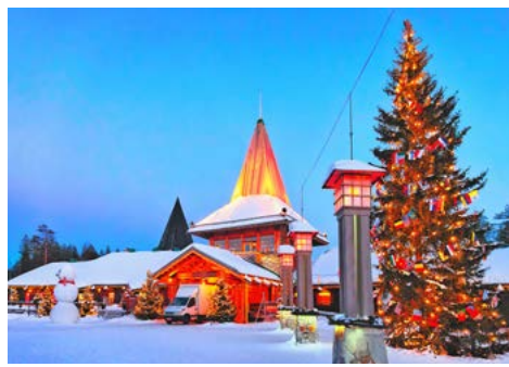
Postamt im Weihnachtsmandorf