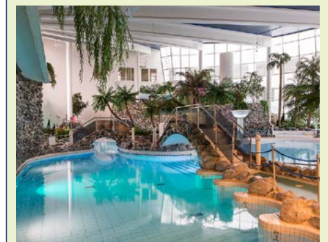
Im Spa-Bereich des Hotels