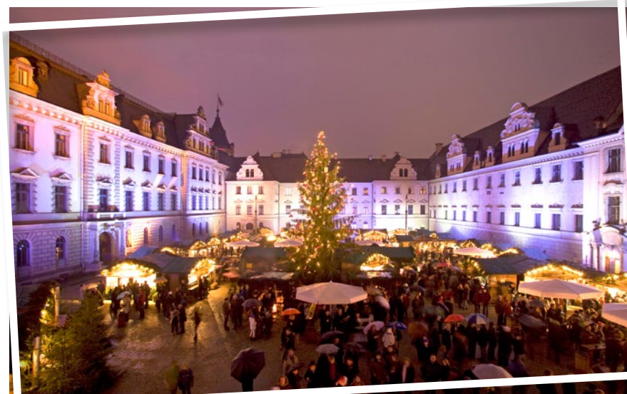
Weihnachtsmarkt Thurn & Taxis

SÜDWEST PRESSE Hapag-Lloyd Gemeinsam die Welt erleben!