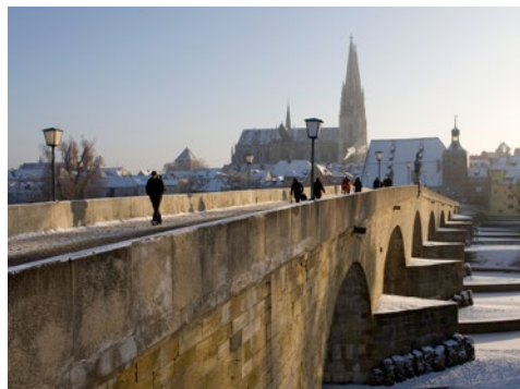
Winterliches Regensburg, © 27512-09_Fotograf Altrofoto_c_RTG

Am frühen Morgen Anreise im komfortablen Reisebus. Gegen Mittag erreichen Sie Regensburg und Sie haben noch Zeit für einen kleinen Mittagsimbiss, bevor Sie am Domplatz um 13:00 Uhr mit einem örtlichen Stadtführer zu einem ca. 1,5-stündigen Stadtrundgang starten. Erkunden Sie die historische Altstadt mit ihren zahlreichen Werken romanischer und gotischer Baukunst. Die bedeutendsten Baudenkmäler wie der Dom, das Rathaus,