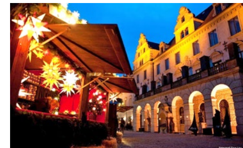
Weihnachtsmarkt Thurn und Taxis, Ostfassade

und neuer Meister, sowie bekannten Weihnachts- und Sololiedern.